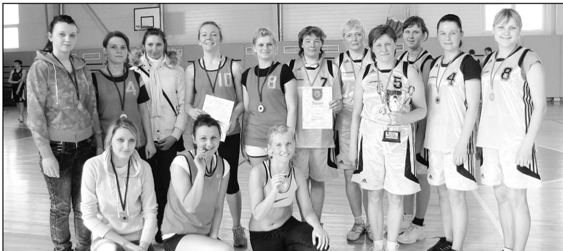
Риебиньская и Стабулниекая женские команды.

Каждую весну Риебиньская краевая дума организует чемпионат края по баскетболу среди мужских и женских команд. В этом году число команд уменьшилось, но стремление к борьбе за каждое очко и победу в игре остались прежними.